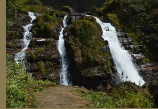
Vértice Nordeste - Formosa/GO

Deste Planalto, porém, a única parte à qual cabe a denominação de central, por se acharem aí as cabeceira de alguns dos mais caudalosos rios do sistema hidrográfico brasileiro, isto é, o Tocantins, o São Francisco e o Paraná.