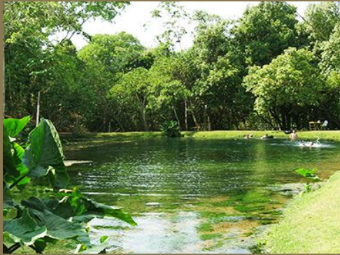
Vértice Noroeste - Vila Propício/GO

Deste Planalto, porém, a única parte à qual cabe a denominação de central, por se acharem aí as cabeceira de alguns dos mais caudalosos rios do sistema hidrográfico brasileiro, isto é, o Tocantins, o São Francisco e o Paraná.