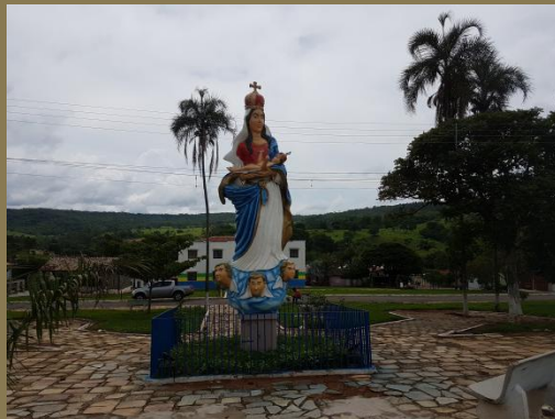
Vértice Sudoeste - Abadiânia/GO