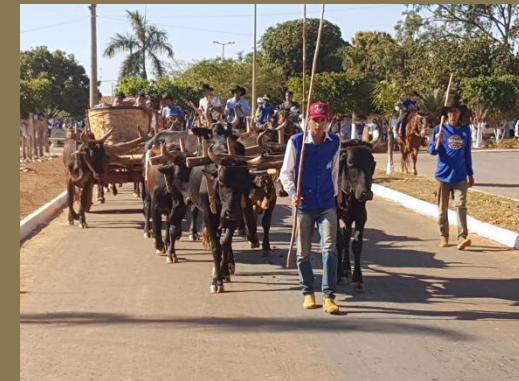
Vértice Sudeste - Palmital/MG