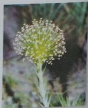
FLOR DO CERRADO