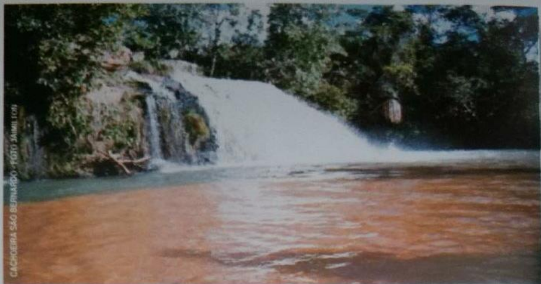
CACHOEIRA SÃO BERNARDO

Foi no final do século XVII, princípio do século XVIII. Julga-se, e com muita razão, que o primeiro povoado existiu no local, conhecido pela denominação de Arraial Velho, a 2 Km da atual cidade. Nada mais existe no Arraial Velho.