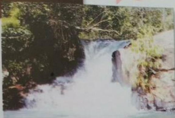
CACHOEIRA CORREDOR DA PEDRA

Complexo de Cavernas São Mateus . É um dos maiores complexos de Caverna da América Latina com formações realmente fantásticas e