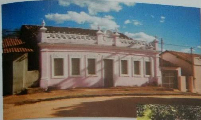
CASA EM ESTILO PORTUGUÊS MARCO DA HISTÓRIA DE SÃO DOMINGOS